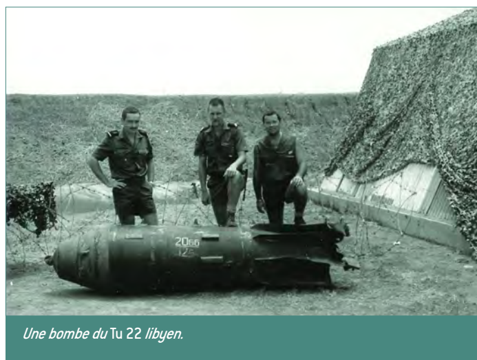
Une bombe du Tu 22 libyen.