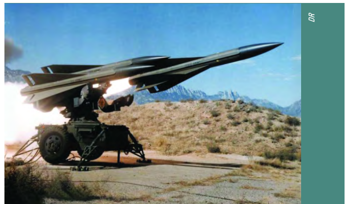
Tir d'un missile Hawk.

Le même jour et à la même heure, un autre bombardier Tu 22 attaquait le terrain d'Abéché dans l'Est du pays. Les batteries Crotale ré-