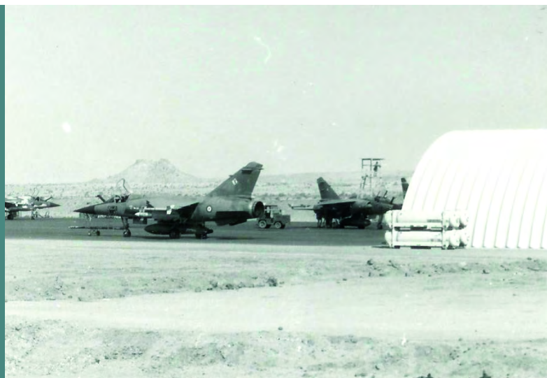
Mirage F1 sur le parking d'Abéché.

Un millier d'hommes assurait la sécurité et la protection des installations et des personnels. Les commandos de l'air, les hommes du 21 e RIMA, les parachutistes du 2 e REP et du 8 e RPIMA, se sont relayés inlassablement autour des points sensibles, dans la chaleur écrasante ou les pluies diluviennes et environnés souvent de nuées d'insectes particulièrement voraces.