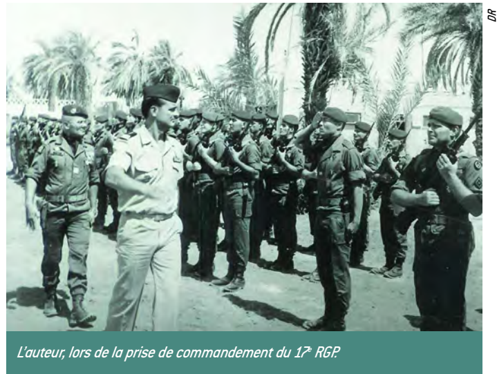
L'auteur, lors de la prise de commandement du 17 e RGP

Avant mon départ pour le Tchad, je n'avais pas vraiment évalué à son juste niveau la véritable complexité politique de ce pays. Les diverses autorités civiles et militaires rencontrées m'avaient fortement recommandé de rester strictement dans le cadre fixé par le Gouvernement. Les Tchadiens ont fait en sorte que la réalité soit différente et il a fallu gérer des situa-