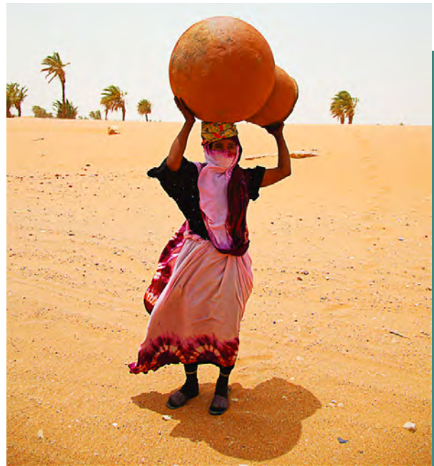
Porteuse de jarre à Faya-Largeau.

Les occupants Libyens avaient été repoussés bien au-delà du 22 e parallèle, d'abord après la chute du terrain de Ouadi-Doum, pris d'assaut par les troupes d'Hassan Djamous en mars 1987, suivie immédiatement par la libération emblématique de Faya-Largeau. Hissene Habré souhaitait que nous nous engagions aux côtés de ses troupes pour les aider à libérer la partie Nord du pays, en particulier la bande d'Aouzou, toujours occupée et revendiquée par les Libyens. Les directives très strictes du gouvernement français nous cantonnaient dans un rôle défensif. Il